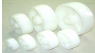
アクティブナイロン車輪