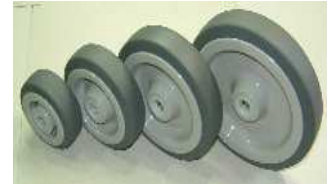
パッションウレタン車輪